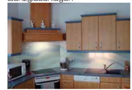
Küchenrückwände aus Glas