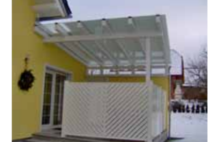
Dächer aus Glas