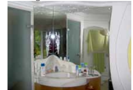
Duschen & Spiegel