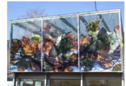
Fotodruck auf Glas