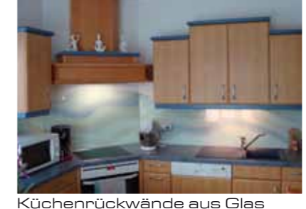
Küchenrückwände aus Glas