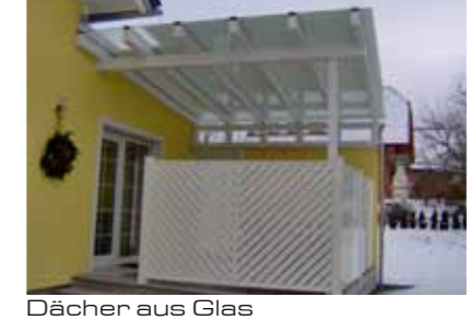
Dächer aus Glas

Gressenbauer Glas & Innentüren GmbH Edlbach 180 | 4580 Windischgarsten T: 0664 / 500 29 55 | F: 07562 / 610 120 E: office@glasbruch.at | W: www.glasbruch.at