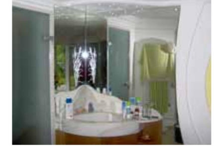
Duschen & Spiegel